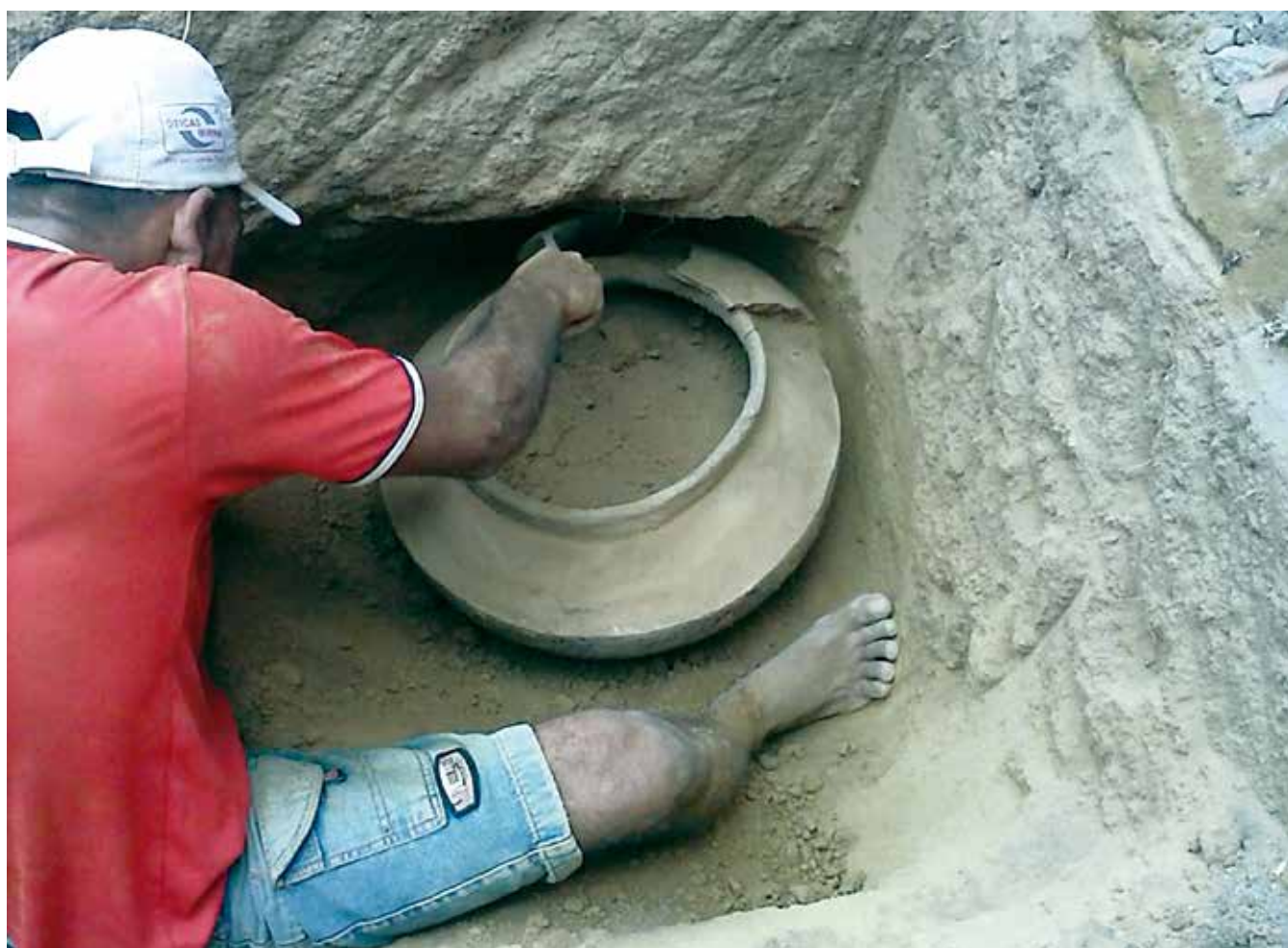
Pedreiro tira vestígio de terra de urna que pode revelar origem de povo que habitava a região de Cuité em tempo remoto