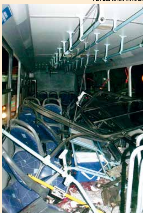
O choque com a árvore destruiu a frente do ônibus e destruiu a área destinada ao usuário