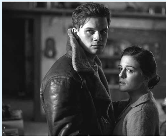
Produção de terror e drama durante a segunda guerra

Esses livros, que a princípio não têm relação entre si, me fazem refletir sobre como existem alternativas para o cotidiano jornalístico ordinário, sobre como as mudanças podem ser saudáveis para o profissional e sobre como a abertura de horizontes é essencial para que as histórias sejam contadas de maneiras diferentes, possibilitando, assim, um entendimento melhor do mundo que nos rodeia.