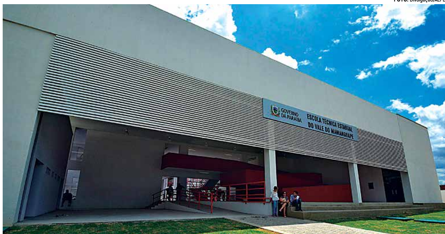
Jovens terão acesso a cursos de Agronegócio e Manutenção e Suporte de Informática, trazendo competitividade para o mercado local

"A grande saída para o Brasil é tornar as escolas úteis, porque o Ensino Médio por si só não basta nesse mundo competitivo", afirmou o governador