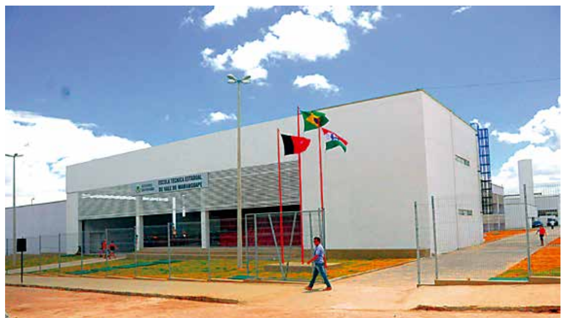
Os governos do Estado e Federal investiram R$ 9,3 milhões na construção da nova escola técnica