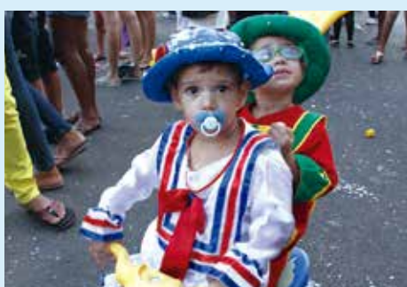
Folia de Rua teve ontem Muriçoquinhas

Máscaras, marchinhas e 25 bichos fazem a folia de hoje