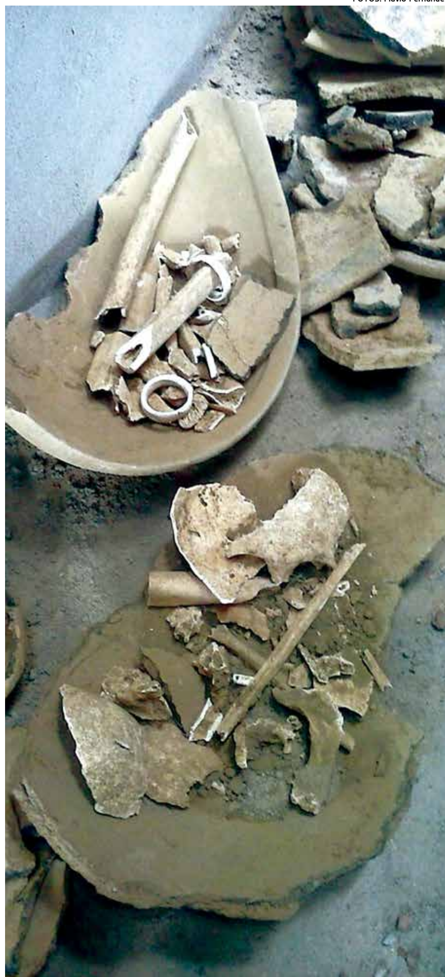
Achados são de grande importância para a Arqueologia, diz técnico do Iphan