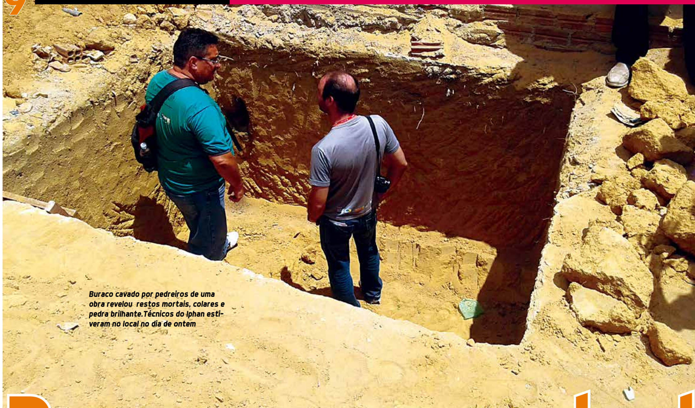
Buraco cavado por pedreiros de uma obra revelou restos mortais, colares e pedra brilhante. Técnicos do Iphan estiveram no local no dia de ontem