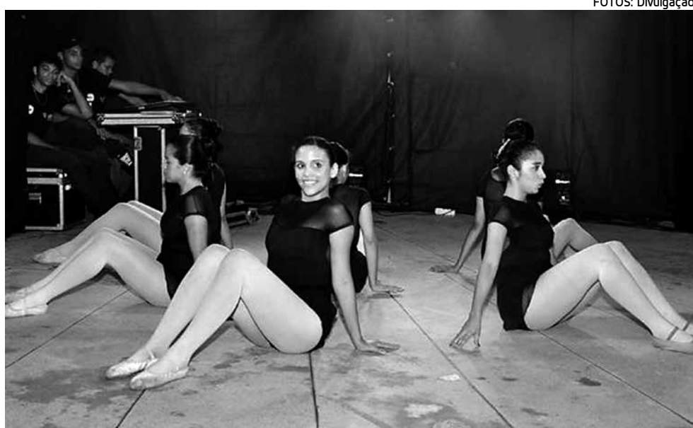
Alunas realizando performances durante uma das atividades oferecidas pela instituição

A Funesc e o Cearte iniciaram a parceria com o objetivo de dar melho-