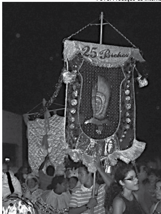
"Os 25 bichos" é um dos mais antigos blocos de Jaguaribe; "Os Portadores Folia", um dos novos na capital