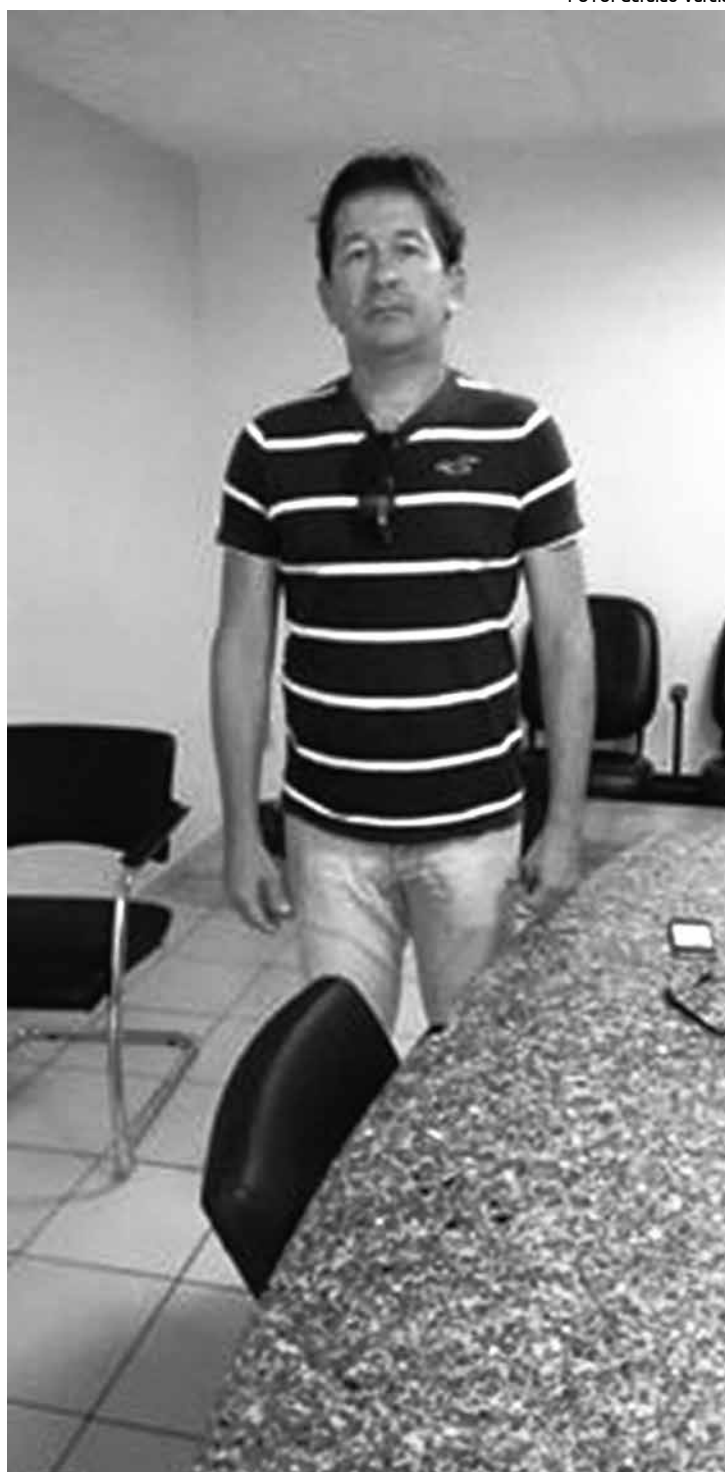
Presidente da Comissão afirmou que árbitros foram capacitados