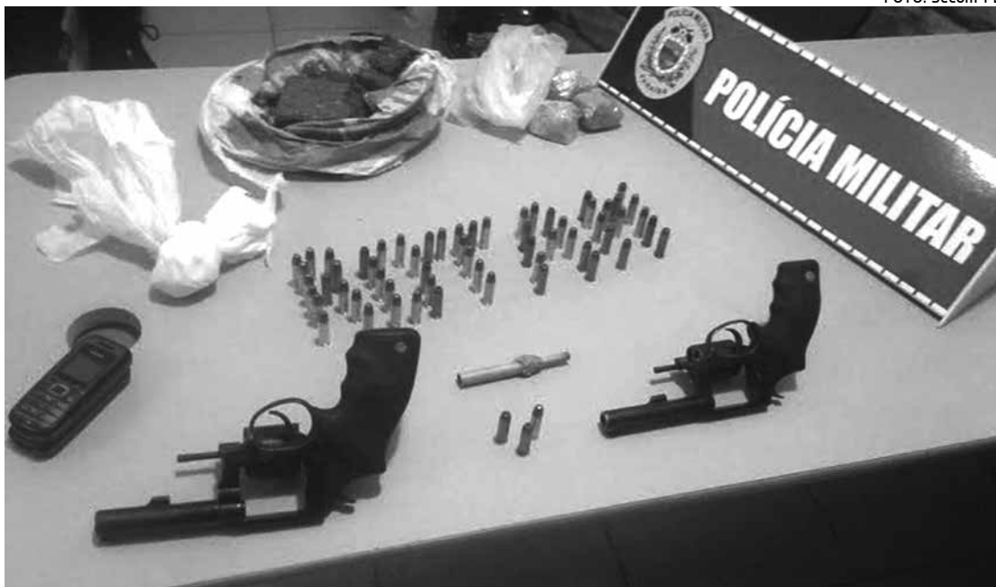
Revólveres calibre 38, muita munição, telefone celular, maconha prensada e pedras de crack

O fogo atingiu apenas uma suíte e não se espalhou pelo resto do apartamento, só a fumaça invadiu o prédio