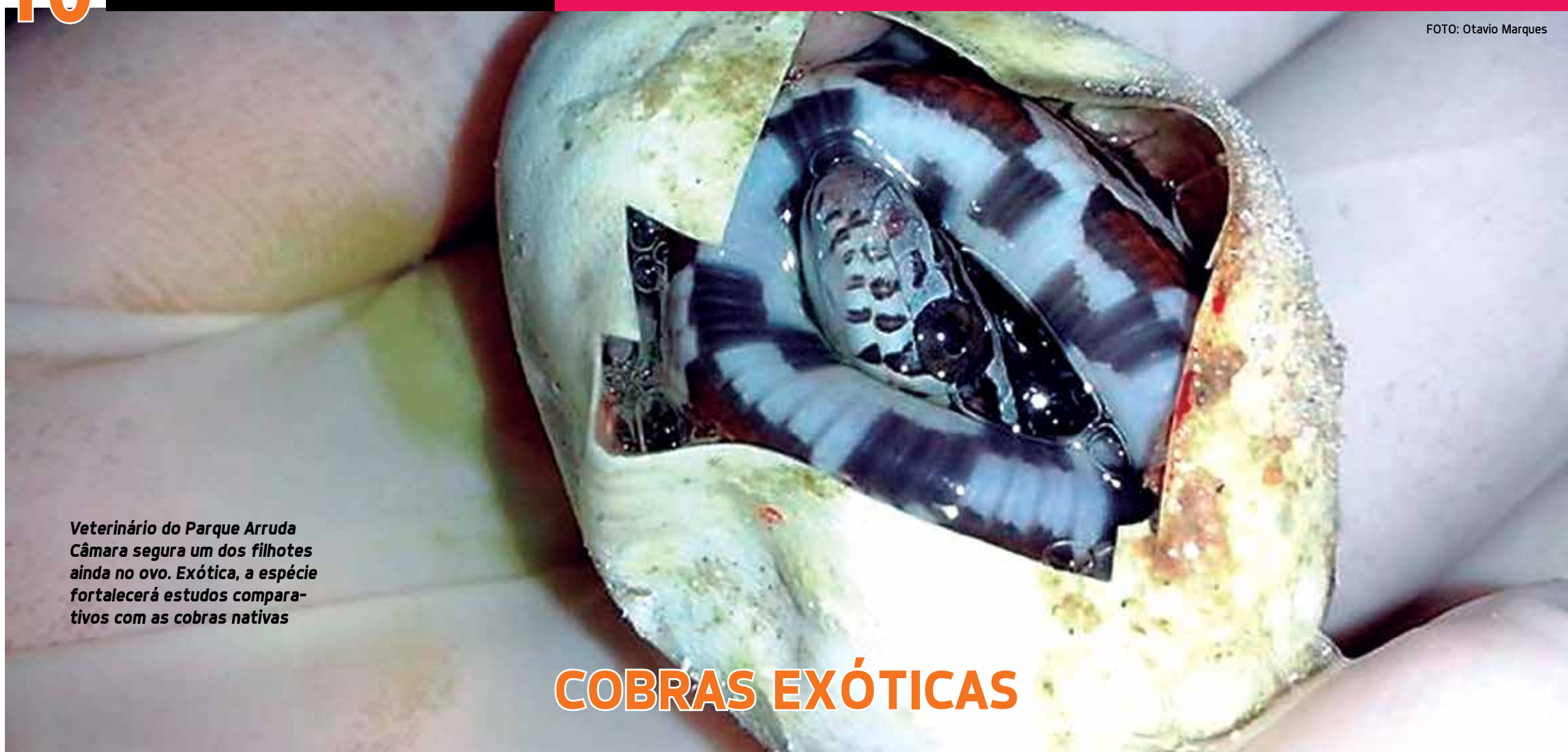
Veterinário do Parque Arruda Câmara segura um dos filhotes ainda no ovo. Exótica, a espécie fortalecerá estudos comparativos com as cobras nativas