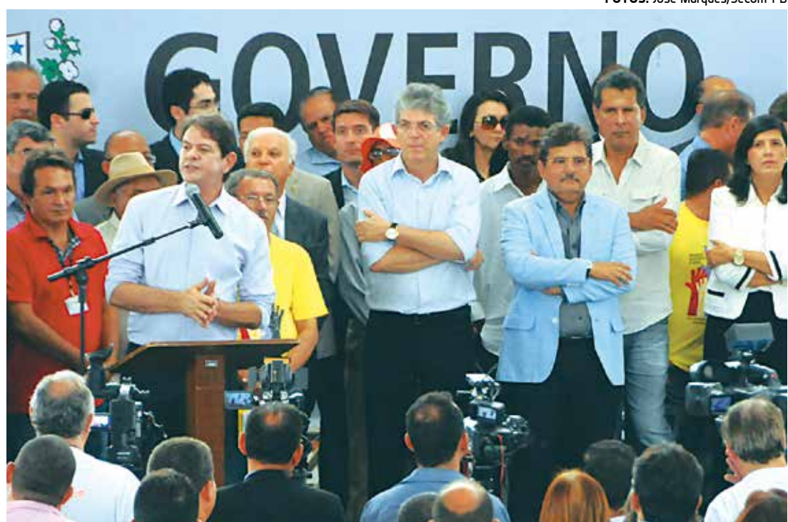
O ministro Cid Gomes disse que a escola representa um caminho e uma profissão para os jovens

pedrada na madrugada de ontem, na capital. O motorista perdeu a consciência e o controle do veículo que foi lançado contra uma árvore. PÁGINA 13