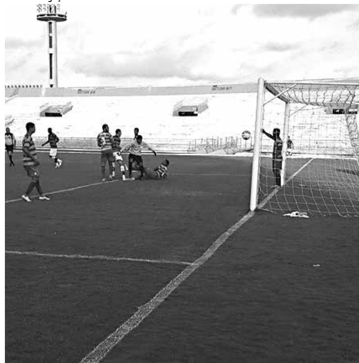
No Estádio Almeidão, o Campinense goleou o Miramar por 4 a 0