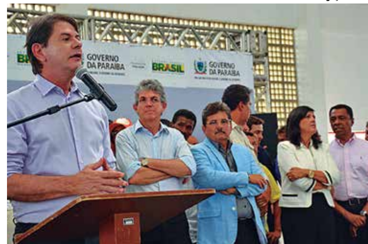
Cid Gomes destacou que escola serve de modelo para o Brasil