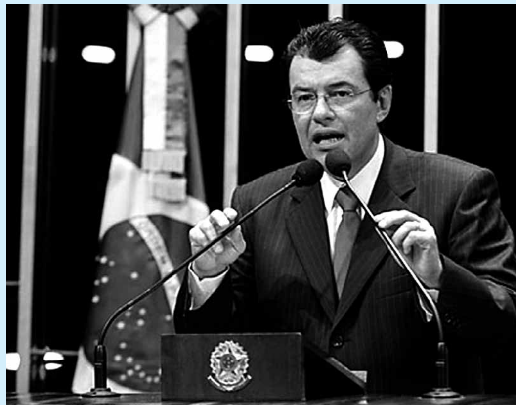
O ministro Eduardo Braga disse que o governo pode lançar uma campanha de racionamento

O horário de verão começou no dia 19 de outubro para os estados das regiões Sul, Sudeste e Centro-Oeste e acabaria no dia 22 de fevereiro.