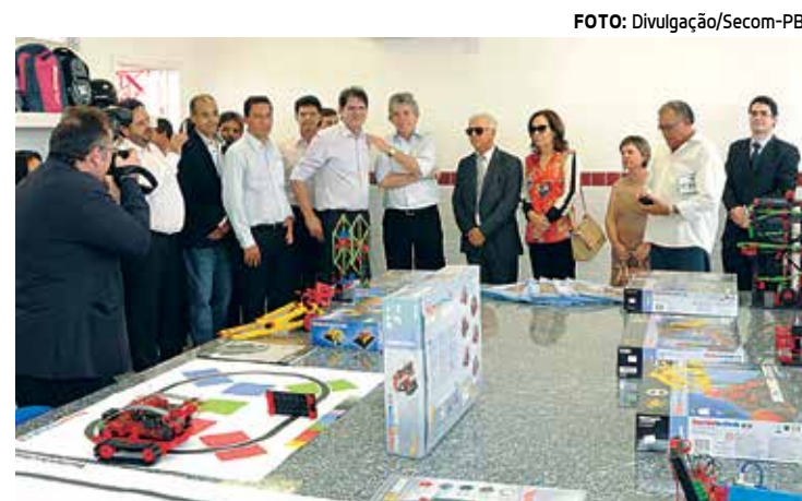
De início, 160 vagas de cursos profissionalizantes serão criadas